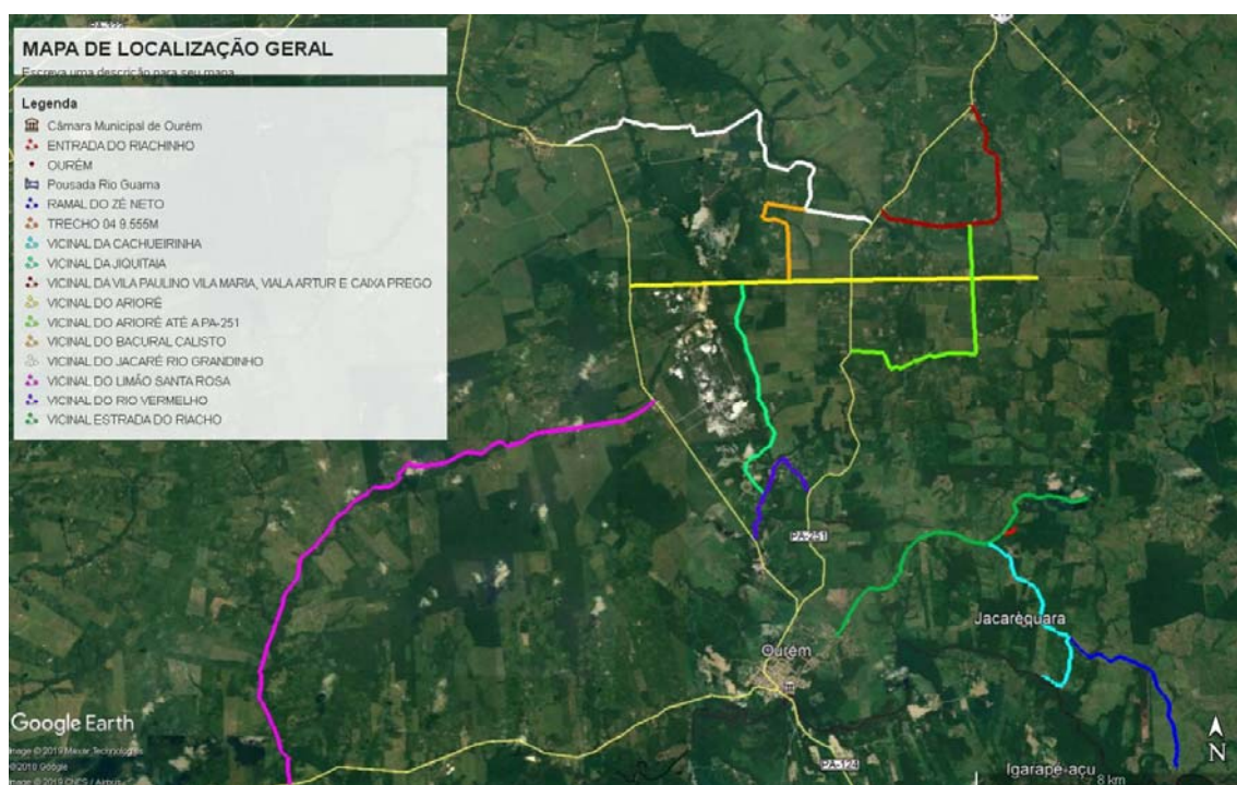
Imagem 01: Mapa de Localização Geral