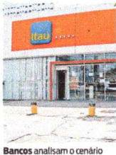
Bancos analisam o cenário

Bancos privados adotam cautela na redução da taxa de juros