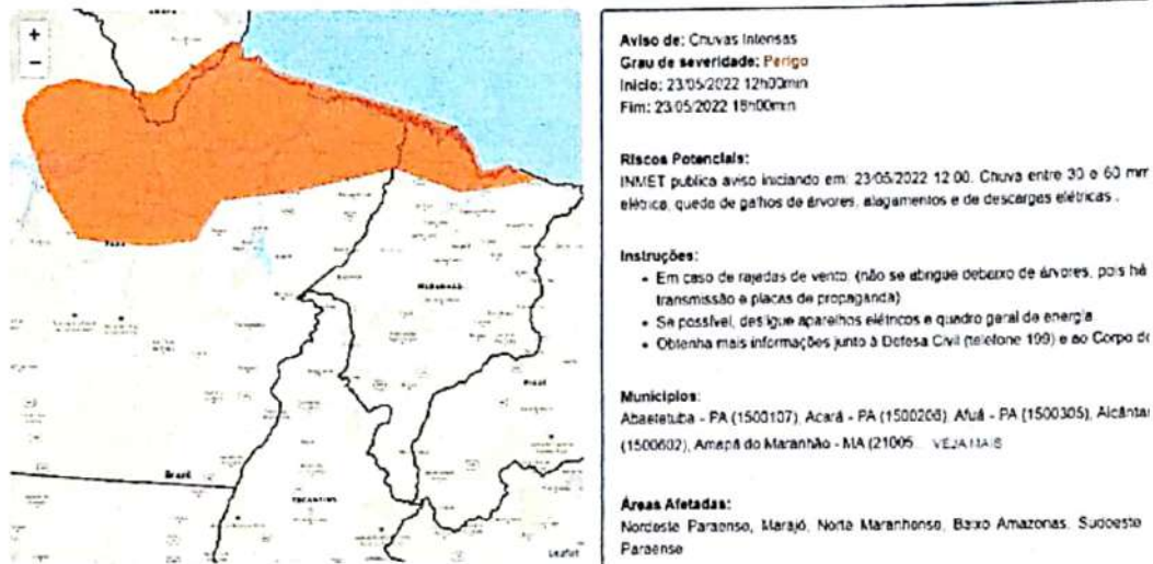
Figura 4 – Detalhe do Mapa mostrando que o município está em zona de perigo Maio-2022 (INMET – 2022)

Contudo, com as fortes chuvas e o alto índice pluviométrico nas áreas identificadas no relatório fotográfico anexado, acabaram gerando danos na infraestrutura: nas estradas vicinais, pontes de madeira, tubulações de concreto e deslizamentos de terra.