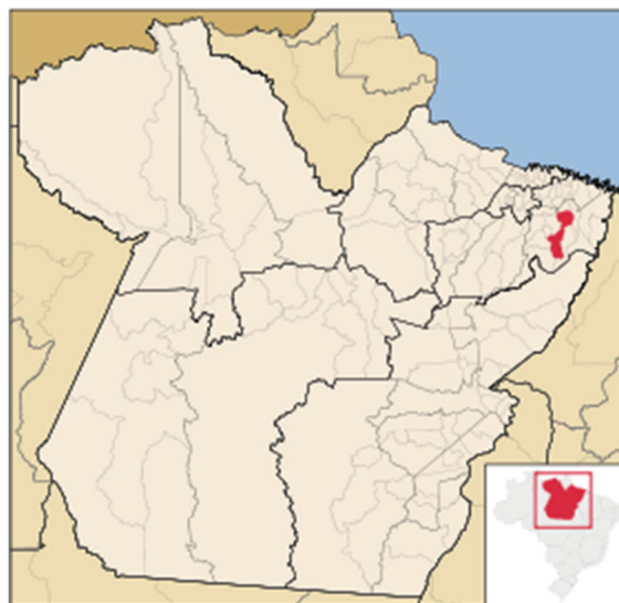
Mapa 1: Mapa de localização do município em referência ao estado do Pará (1° 44' 42" S 47° 03' 54" O).

O Município de Ourém é um município brasileiro do estado do Pará. Com 40 metros de altitude, localiza-se à latitude 01°33'07" sul e à longitude 47°06'52" oeste. Sua população estimada em 2020 era de 17.961 habitantes, distribuídos em 561,710 km 2 de área.