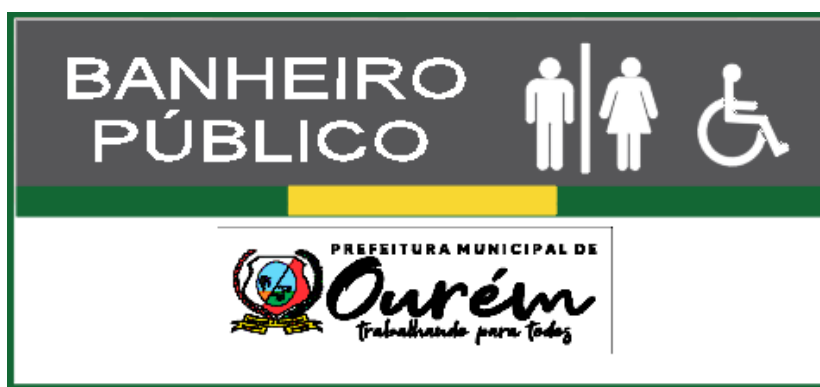
Placa de Identificação Externa – Banheiro Publico (1,50mx0,70m)

Haverá sinalização externa e interna indicando o tipo do equipamento: Banheiro Público e cada função: feminino / masculino e PCD feminino / masculino, através de Placas indicativas, em acrílico adesivada, com hologramas universais medindo 1,50mx0,70m, para area externa e para área interna medindo 0,20mx0,30m.